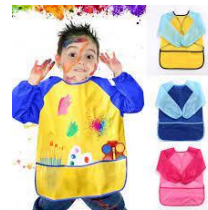
1 chemise usagée ou 1 blouse pour faire de la peinture