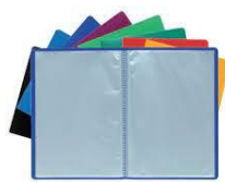
Un porte vues (100 vues)