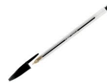
1 stylo noir