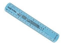
Une règle 20cm

Méfiez-vous des premiers prix et des objets fantaisie, ils sont généralement peu fiables ! Ils fonctionnent mal, s'usent vite ou cassent et doivent alors être rachetés. Utilisez un cartable léger (sans roulettes) et solide. Nous vous remercions par avance pour votre collaboration.