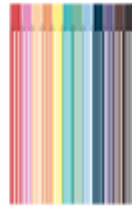
12 feutres moyens