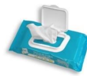
Un paquet de lingettes