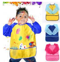
1 chemise usagée ou 1 blouse pour faire de la peinture