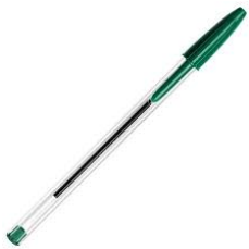
1 stylo vert