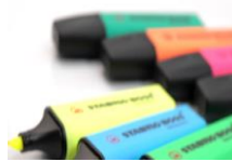
1 surligneur « fluo »